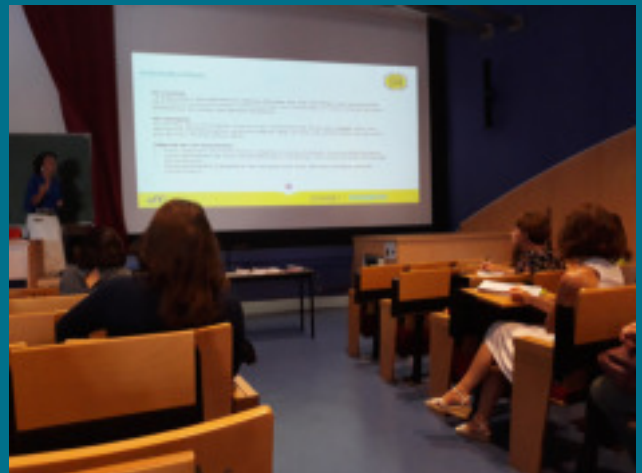
Accueil des personnes en reprise d'études - Édition 2018