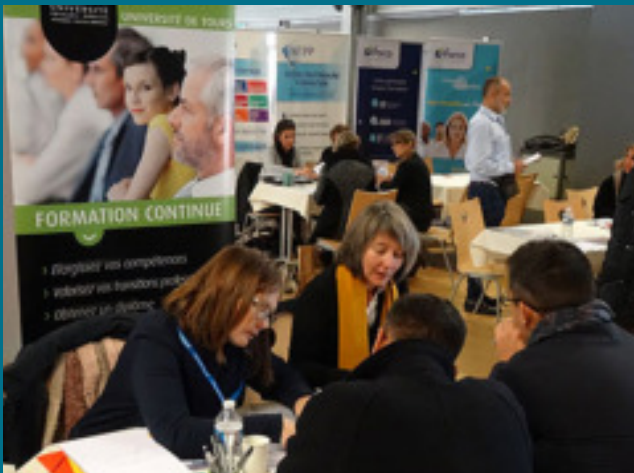
Carrefour de la formation continue - Édition 2018