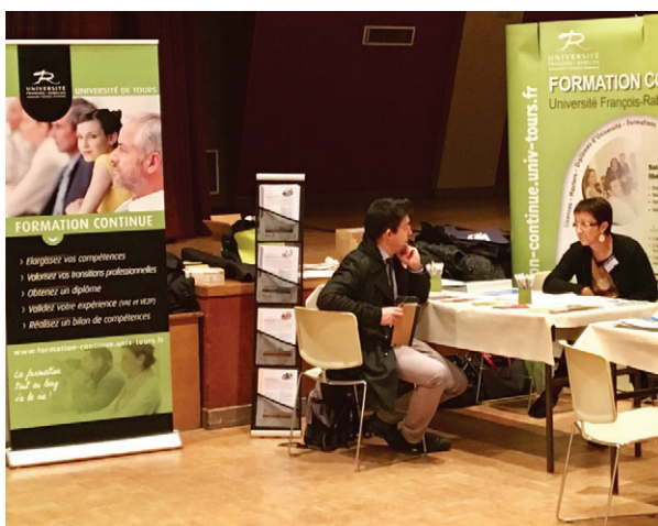
Nouvelle Vie Professionnelle - Édition 2016

Informations mises à jour en mars 2017 et susceptibles d'évolutions. Les tarifs s'appliquent aux formations de l'année universitaire 2017-2018. Les prix sont nets, la formation continue universitaire n'étant pas soumise à la TVA. Les règlements sont à effectuer à l'ordre de l'agent comptable de l'université de Tours. Les formations se déroulent selon les règles universitaires en vigueur à la date de démarrage. Elles sont organisées sous réserve d'un nombre suffisant de participants. Conformément à la législation, elles font l'objet soit d'une convention de formation continue (prise en charge par une entreprise ou un financeur institutionnel), soit d'un contrat de formation professionnelle (prise en charge individuelle). Les descriptifs de ce document ne constituent pas des éléments contractuels.